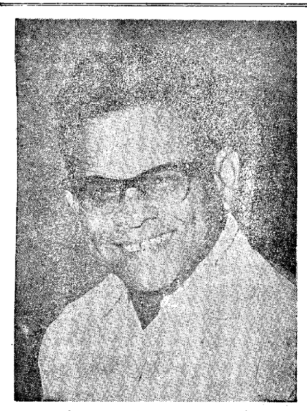
్రస్త్యాత దర్శకుడు : ఆదు ర్థి సుబ్బారావు

"గొవు మ్యుజీషియన్లదరూ అంతనోయ్ దూరం60 మైదు.