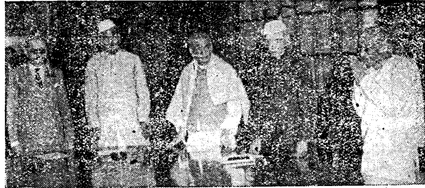
ఆక్టింగ్ గవర్నర్ జనరల్ గా అధికారాన్ని స్వీకరించిన అనంతరం, మంత్రివర్గభ్యుల అభినందనల నందుకొంటున్న శ్రీ రాజగోపాలాచారిగారు.

పె: ఏమిటి? తెల్లాడిమతమా?! వాడిమతా న్నే అనుష్ఠించి మీరంతా వాడిదేశం పోరాదూ యీ పనికిమార్చి దేశంలో నుండకుండా? సమస్త విషయాల్లో వాడి సిద్ధాంతాల్నే అనుసరించ రాదూ ఇట్లా మా ప్రాణాల్లియకుండా?! ఏమి